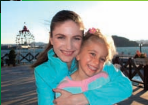
fotoaparát Fujifilm FinePix s Real Photo Technology